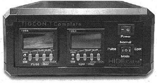
「TIGCON-T Spot」と「同Pulse」2台の機能を集約した「同Complete」

出力時間を極短時間に設定できるため、特に薄板の溶接時に低歪の溶接を実現することができるとのこと。 なお、「TIGCON-T Spot」と同じく、通常溶接とパルスモードの変更にスイッチ1つで切替可能となっている。 3つ目は、これら2つの製品を1つのパッケージにまとめた装置「TIGCON-NTPulse」。 たとえば、「接続ケーブル」や「溶接サンプル」、「動作