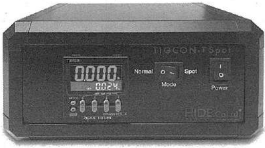
極短時間アークスポット装置「TIGCON-T Spot」

1つ目は、極短時間アークスポット装置「TIGCON-T Spot」。 溶接機に標準で備わっているアークスポット時間を、さらに短時間で制御可能。タイムは、0.001秒から0.999秒まで設定できるものの、溶接機の能力の問題で最短0.01秒